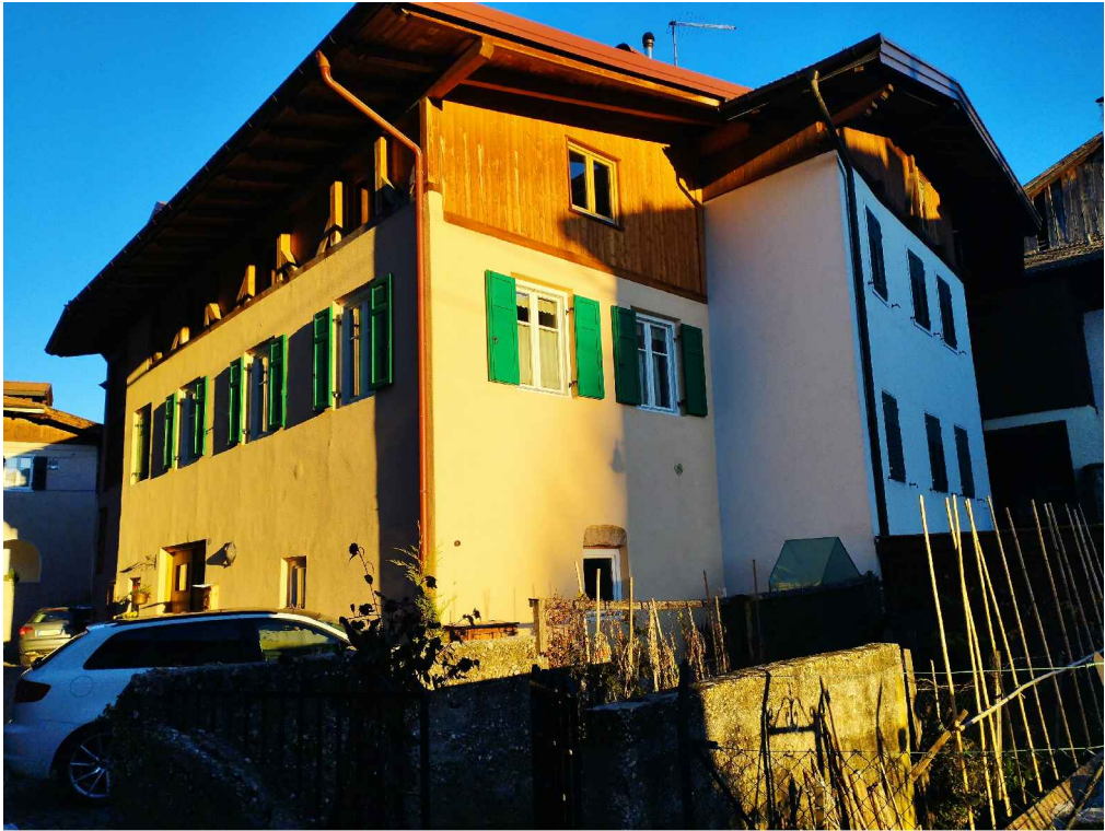
VISTA DA SUD-OVEST

COROGRAFIA: Carta Tecnica P.A.T. - scala 1:10.000